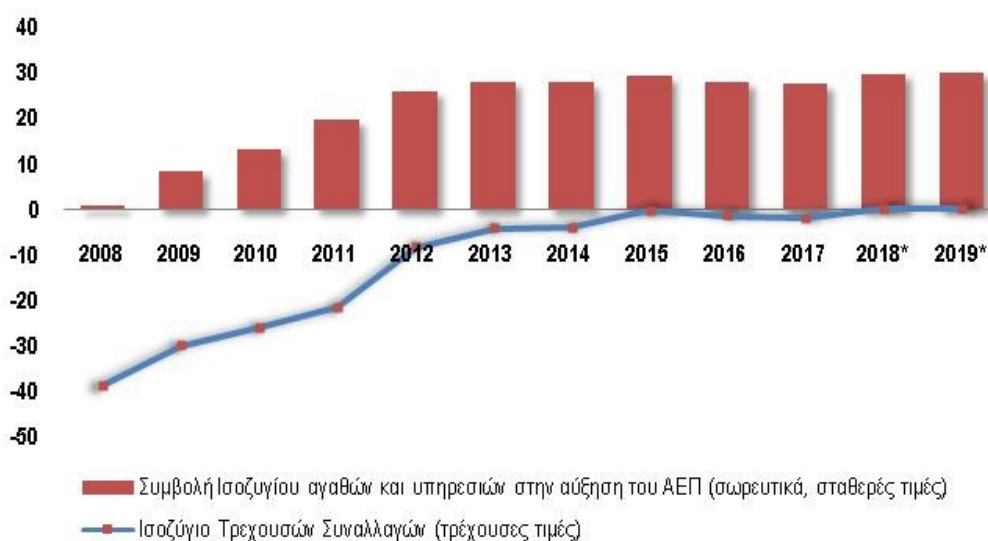
Διάγραμμα 1.2 Εξέλιξη του ισοζυγίου τρεχουσών συναλλαγών (σε δισ. ευρώ)

Πηγή: Ετήσιοι Εθνικοί Λογαριασμοί 2017(Ελληνική Στατιστική Αρχή), Υπουργείο Οικονομικών * Εκτιμήσεις / Προβλέψεις